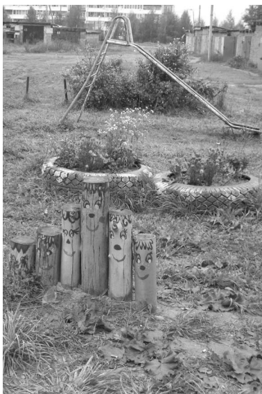
Один из дворишков в поселке Воротынский.