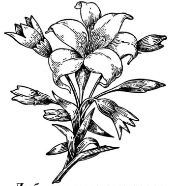
Любящие твои сестрички.

Не жалея, что годы пролетели, Тебе на долю выпал трудный век, Тебя мы любим и всегда любили, Наш дорогой, любимый человек!