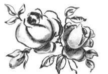
Дети, внуки, правнук.

Спасибо, родная, что есть ты у нас, Что видим и слышим тебя каждый час, За добрую душу и теплое слово, За то, что не видели в жизни плохого, Спасибо тебе, наш родной человек! Желаем здоровья на долгий твой век!